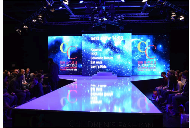
CFC Cologne MODENSCHAU · KÖLN · SEIT 2014