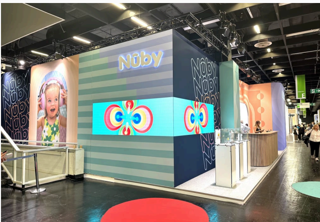
Nuby KIND + JUGEND · KÖLN · 2025