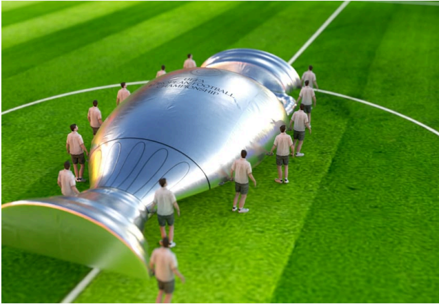
UEFA EURO 2024 ERÖFFNUNGSZEREMONIEN · 2024

Sechs Auszüge aus den letzten Jahren — von der größten Sportbühne Europas bis zur kuratierten Kindermode-Präsentation. Jedes Projekt: Konzept und Bau aus einer Hand.