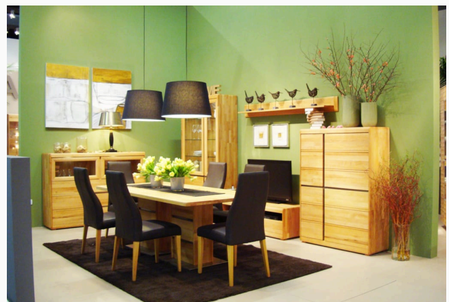
IMM Cologne MÖBEL-LEITMESSE · KÖLN